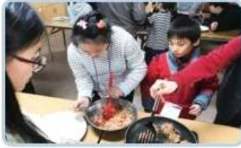
④ 계절학교 참여 학생들이 자립능력을 키우는 목적으로 조별로 반찬을 만들었습니다. 참 맛있게 했습니다.