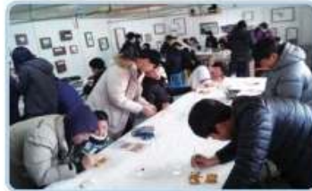
① 원주 폐배공방에서 모자걸이 만들기 체험을 진행하였습니다. 정교함이 필요한 작업이지만 우리 친구들 집중해서 다들 예쁘게 만들었습니다.

2018년 1월 15일(월)부터 26일(금)까지 2주간 지역 내 초·중고 장애학생과 신청을 접수한 비장애학생을 대상으로 겨울방학 계절학교 “내일로 가는 길”을 진행하였습니다. 이번 계절학교는 기초생활습관형성과 한글, 수학 등 기초교육 제공을 통한 일상생활기능 및 자립능력 향상을 목적으로 진행되었습니다. 한글, 수학교육 및 체육활동, 템플스테이 등 다양한 프로그램을 진행하며 2주간 즐거운 추억을 만들어 나갔습니다. 추운 겨울바람을 잊을 만큼 즐거웠던 겨울방학이었기를 바랍니다. 2주간 우리 친구들이 프로그램에 참여할 수 있도록 도와주신 자원봉사자분들께 감사의 말씀드리며, 우리 복지관은 곧 다가올 여름 계절학교에도 함께 즐기고 배울 수 있는 프로그램을 준비하도록 하겠습니다. 우리 친구들 여름에 다시 만나요!