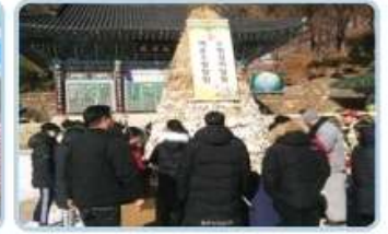
⑥ 양평군 용문사 템플라이프를 통해 계절을 배우고 몸과 마음을 정리해주는 시간을 가졌습니다.