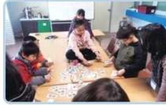
⑤ 우리 친구들이 초등학교 입학하여 어려움을 겪지 않도록 한글교육 등 기초학습향상 교육을 진행하였습니다.