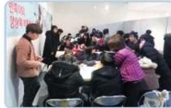
② 원주 치악예술관에서 전시중인 <반쪽의 상상력 박물관> 견학을 다녀왔습니다. 재활용 쓰레기로 작품을 만들어 상상력과 창의력을 키우는 활동을 진행하였습니다.