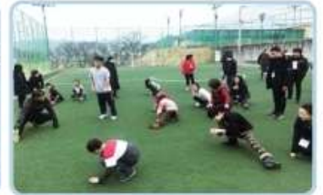
③ 체육활동 통해 우리 친구들과 자원봉사자 친구들, 담당 선생님들 모두가 함께 조별 축구 경기를 진행하였습니다. 서로 합심하여 재미있는 놀이를 통해 협동심을 배웠습니다.